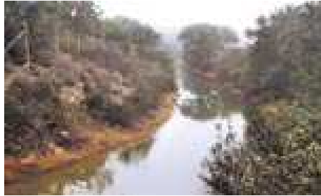
Canal de Guadarrama. Paso sobre arroyo.

Pero al margen de toda esta documentación oficial el camino del Pardillo reúne especiales valores paisajísticos y culturales. Tiene interesantes ejemplos de ingeniería civil borbónica; en el río Guadarrama hay molinos harineros e industriales del siglo XVI; es testigo del fallido intento de unir, vía fluvial, Madrid con el mar; disfruta de unas excelentes vistas; permite conocer el cañón del Guadarrama, etc. etc. En fin que es depositario de un patrimonio común que nadie tiene derecho a apropiárselo.