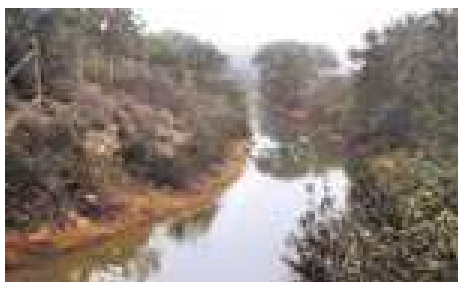
Canal de Guadarrama. Paso sobre arroyo.

Pero al margen de toda esta documentación oficial el camino del Pardillo reúne especiales valores paisajísticos y culturales. Tiene interesantes ejemplos de ingeniería civil borbónica; en el río Guadarrama hay molinos harineros e industriales del siglo XVI; es testigo del fallido intento de unir, vía fluvial, Madrid con el mar; disfruta de unas excelentes vistas; permite conocer el cañón del Guadarrama, etc. etc. En fin que es depositario de un patrimonio común que nadie tiene derecho a apropiárselo.